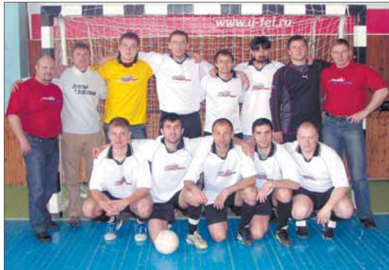
Команда «Прорыв» (крайние справа и слева во втором ряду) и ее друзья

12, 13 апреля в Тюменской области прошел открытый турнир по мини-футболу в рамках городской программы «Нет наркотикам». Шесть команд принимало участие в этом проекте, задуманном властями города Нягань и «Церковью Иисуса Христа». Для участия в нем были приглашены сборная команда «Атлетов в действии» по мини-футболу из Молдавии и силовая команда «Прорыв» из Ярославля.