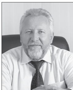
Епископ Сергей Ряховский

Дорогие братья и сестры! Поздравляю вас с одним из величайших христианских праздников – Днем Пятидесятницы!