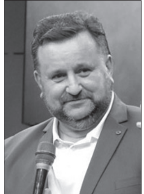
Епископ Андрей Дириенко

В жизни Моисея был страх Господень. У него был Божий страх, а у остальных — ужас.